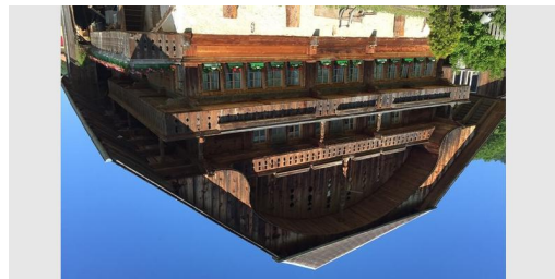
TOP Stockentaler Hausweg - Blumenstein Art Themenweg